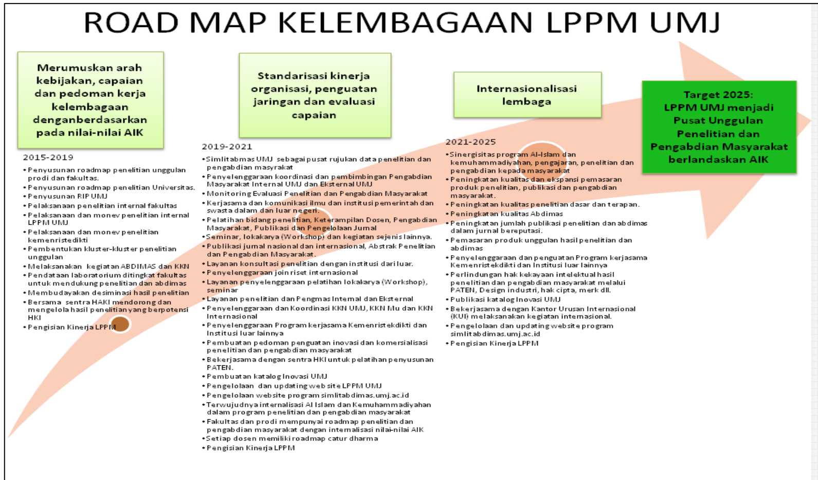
Gambar 1. Road Map LPPM UMJ Tahun 2020-2025