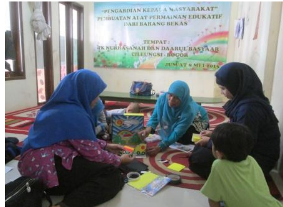
Gambar 1. Pembuatan Alat Permainan Edukatif dari Barang Bekas dengan Mitra

dengan lebar garis 1 pt dan seharusnya memiliki kualitas kekontrasan yang baik.